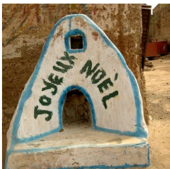
Crèche au Burkina Faso

Si tu as de nombreuses richesses donne ton bien, si tu possèdes peu donne ton coeur